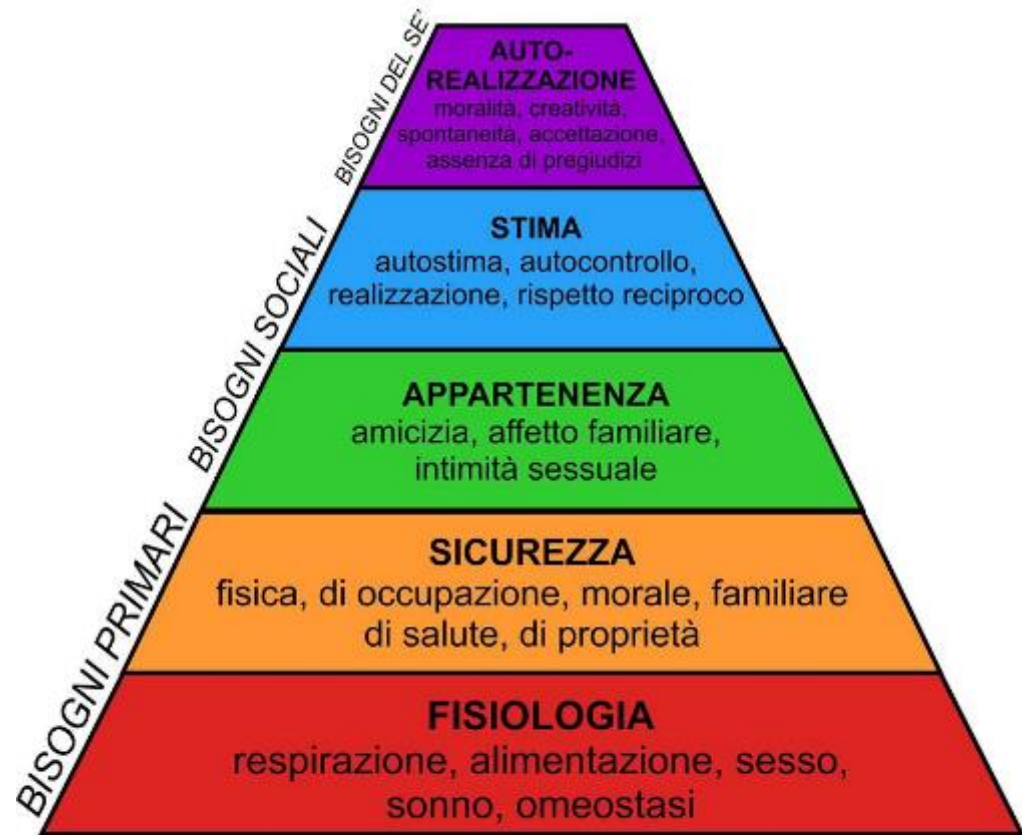
La piramide dei bisogni Maslow (1954)

La misura secondo la quale l'impegno nel compito può essere motivato dalla disponibilità del rinforzo dipende dalla misura in cui coloro che apprendono attribuiscono valore al rinforzo, si aspettano che venga conferito una volta completato il compito, si ritengono in grado di portare a compimento il compito con successo e sono convinti che agire in questo modo per avere accesso al rinforzo varrà i costi in termini di tempo, di impegno e di opportunità di intraprendere percorsi d'azione alternativi. Tra le prime teorie motivazionali ci sono le cosiddette teorie dei bisogni. Queste teorie spiegano i comportamenti come risposte a bisogni .