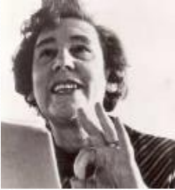
Joan Woodward (1916 – 1971) Sociologa britannica