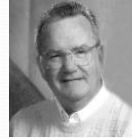
James Thompson (1920 – 1973) Sociologo americano