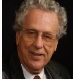
Charles Perrow (1925 – ) Sociologo americano